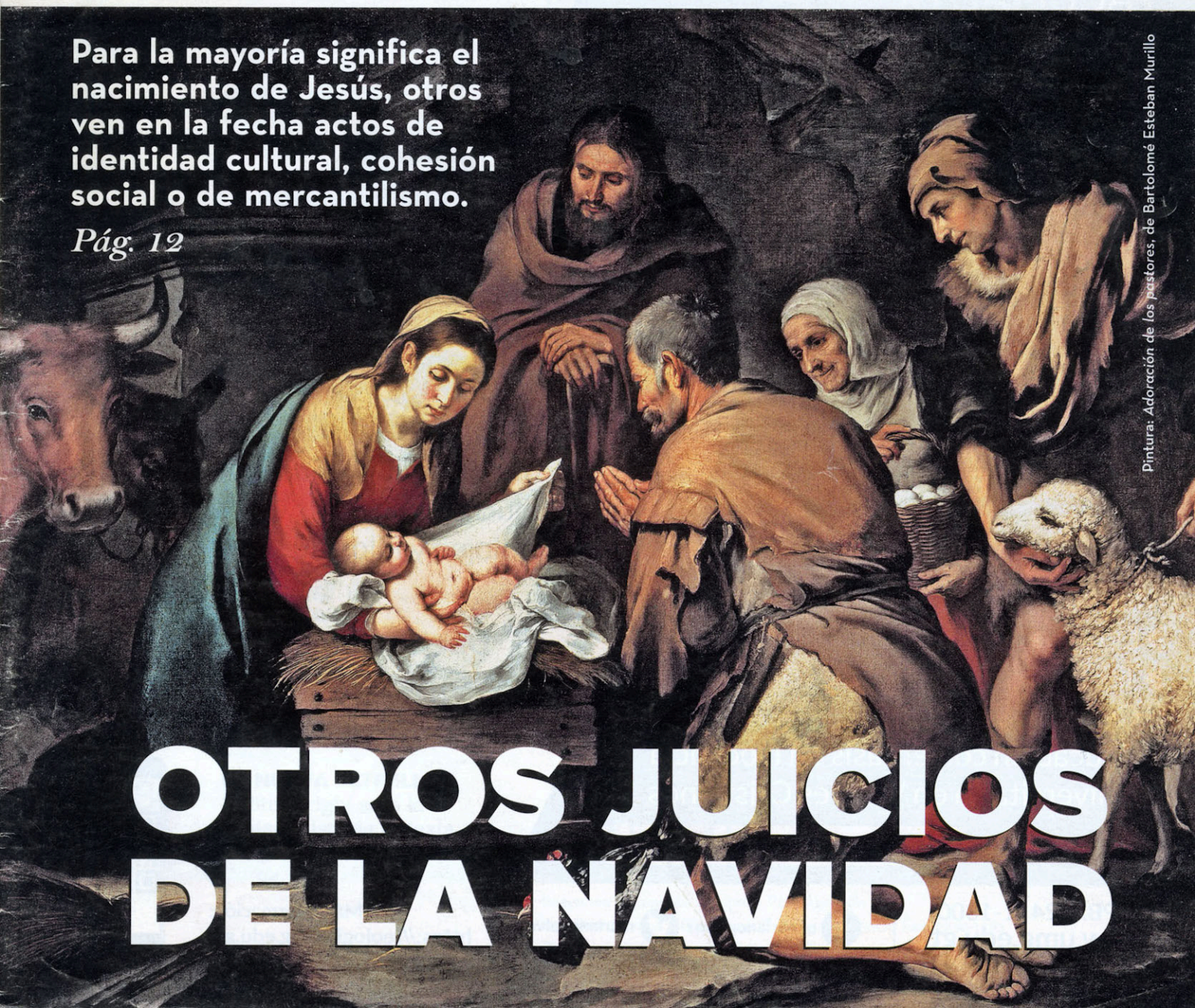
Pintura: Adoración de los pastores, de Bartolomé Esteban Murillo