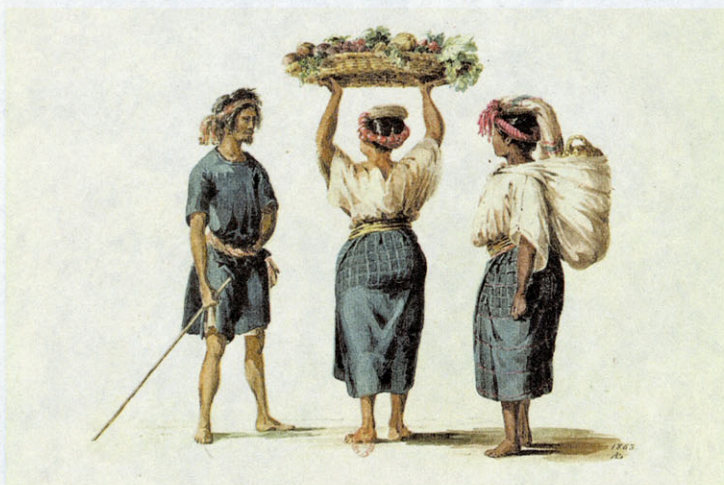
Reflections of Guatemala: Costume and Life in the 19th Century