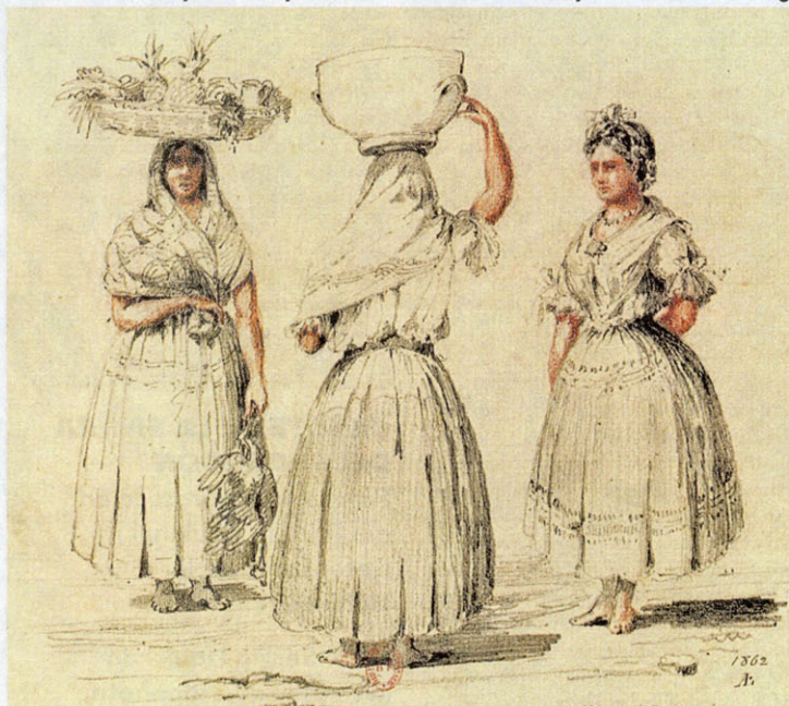
Reflections of Guatemala: Costume and Life in the 19th Century