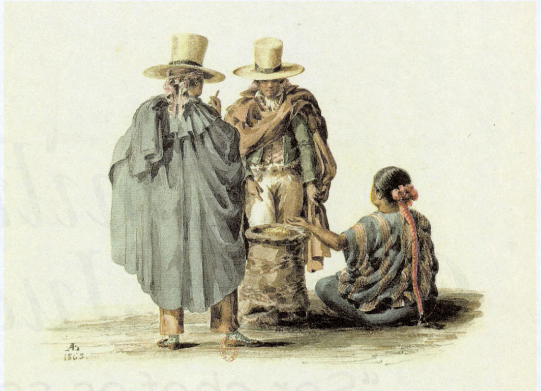
Reflections of Guatemala: Costume and Life in the 19th Century

Además de esta evidencia histórica se analiza la industria textil de la época. "La examinamos y observamos los intentos de la Sociedad Económica para estimularla, así como su declive cuando se comenzó a importar tela tejida a máquina más atractiva y barata de Filipinas, introducida de contrabando por los británicos", explica Greatorex-Bell.