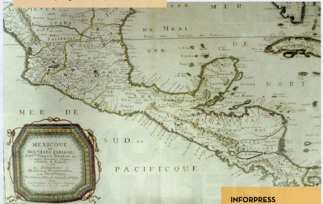
Mapa de 1656, de Pierre Meriette

Fue fundado en 1997. Los documentos que se conservan mezclan los distintos puntos de vista de la sociedad de Guatemala a través de los años. Sus colecciones datan del siglo XVI. Tiene más de 5.5 millones de documentos.