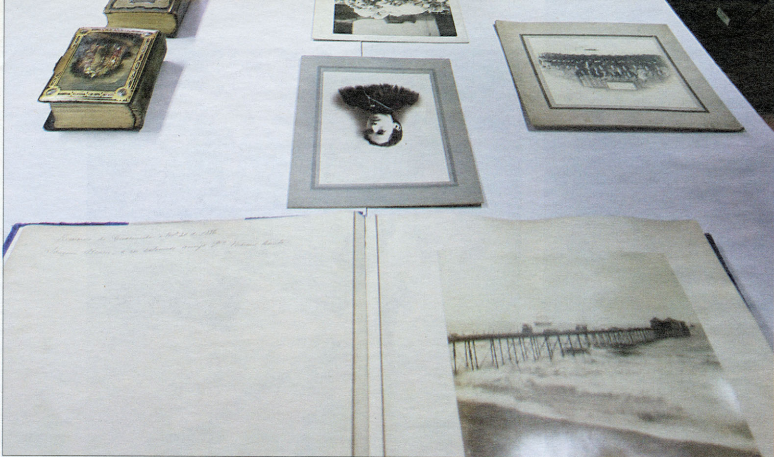
Hay colecciones fotográficas de la década de 1880 con las cuales se buscaba promover el país en el extranjero.

landés, francés y castellano. Entre los múltiples tesoros está Los viajes de Thomas Gage , el cual se encuentra ilustrado con grabados. También hay algunos ejemplares escritos por Garcilaso de la Vega.