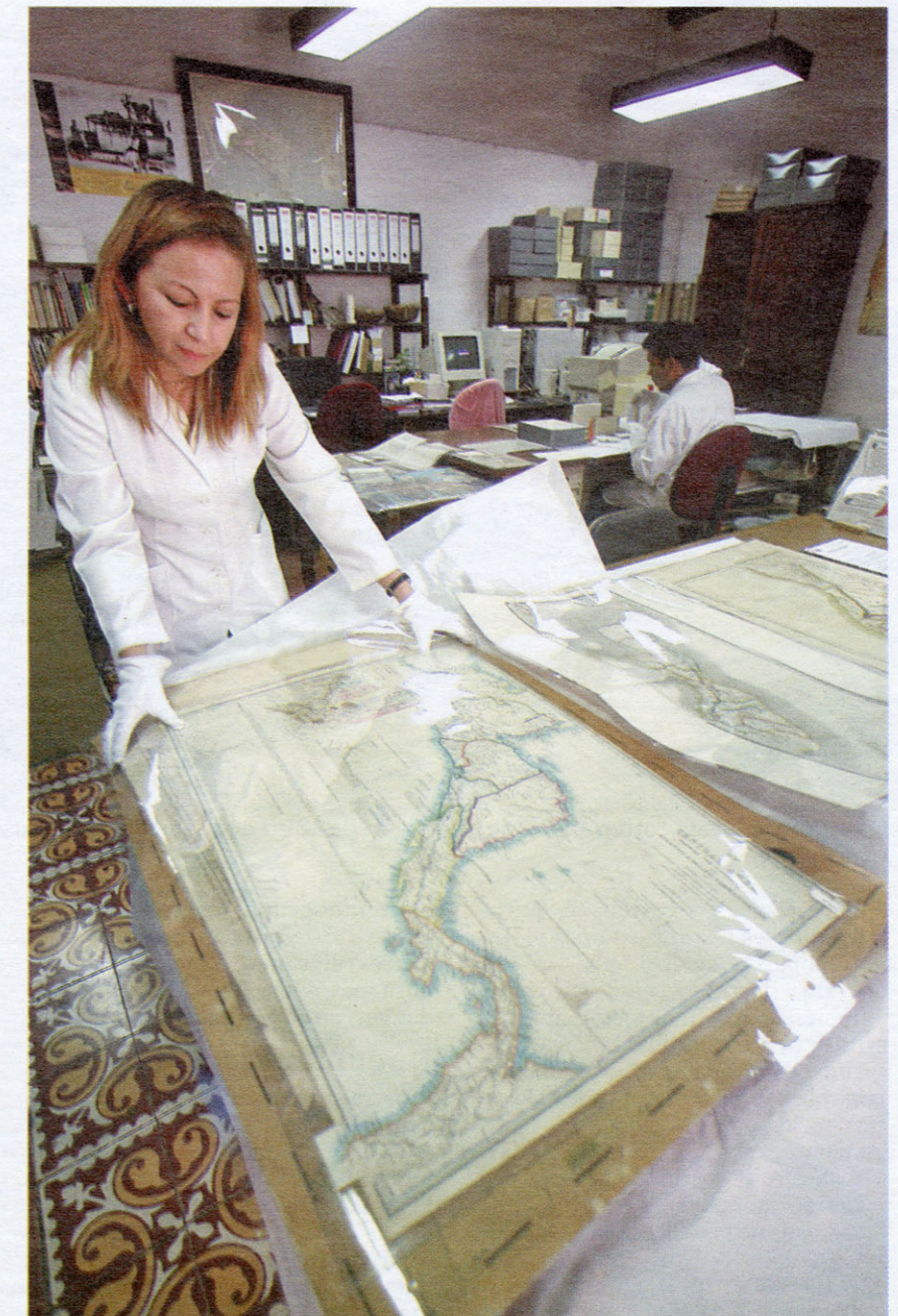
En la mapoteca hay mapas del siglo XVII hechos en base a los recorridos de costa.